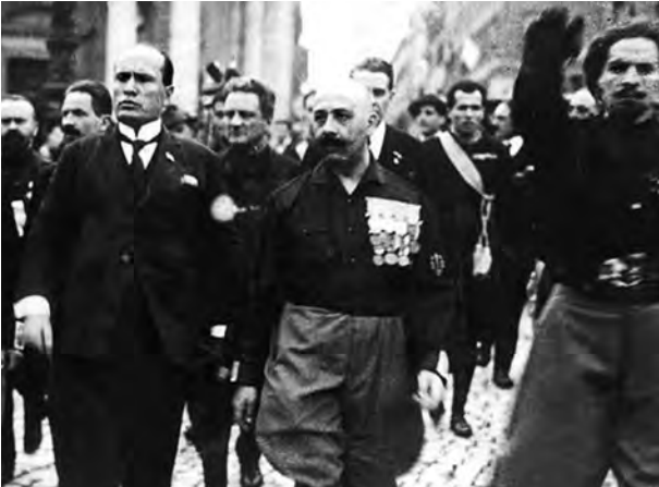
A – Benito Mussolini na manifestação conhecida como Marcha sobre Roma.