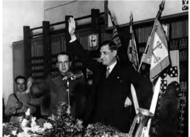
B – Nomeação de António de Oliveira Salazar para ministro das Finanças.