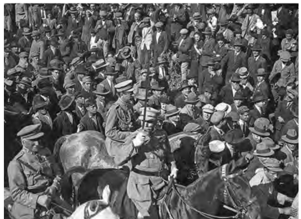
D – Desfile vitorioso de Gomes da Costa e das suas tropas, em Lisboa.