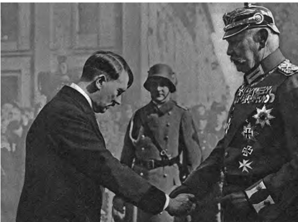
C – Nomeação de Adolf Hitler como chanceler da Alemanha pelo respetivo presidente.