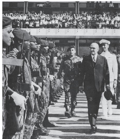
D – Marcello Caetano em visita oficial a Moçambique.