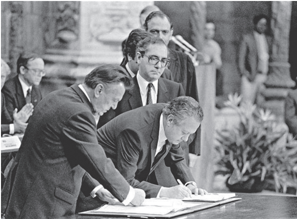
A – Mário Soares assina o Tratado de Adesão de Portugal à CEE.