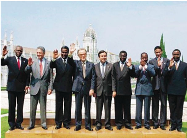
C – Cimeira constitutiva da CPLP, Centro Cultural de Belém, em Lisboa.